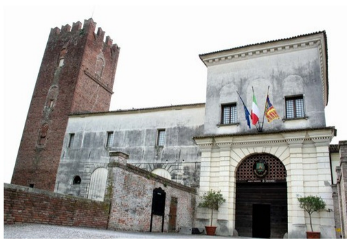
Il castello di Arquà Polesine, sede del municipio

Mentana ospite ad Arquà Polesine tra cultura e buon vino da bere